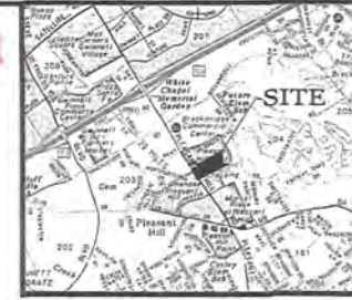
LOCATION MAP NOT TO SCALE